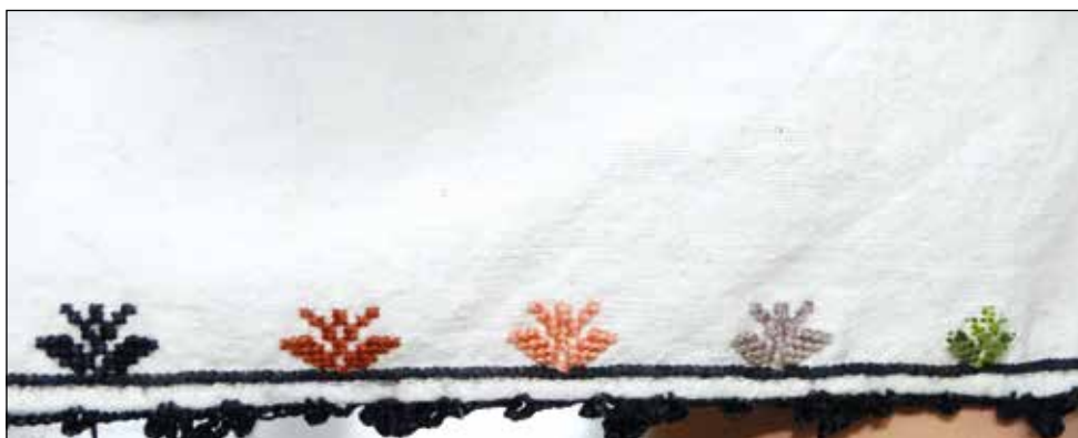
Обр. 11. Задни поли на женска риза „бърчанка“ със стилизиран мотив на „богинята-майка“ от с. Карайсен (ИМ – Павликени, осн.ф. „Етнография“, инв. № 359)