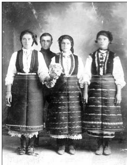
Обр. 1. Момичета от с. Сломер след вършитба, 1917 г. (ИМ – Павликени, осн.ф. „Етнография“, инв. № 2333)