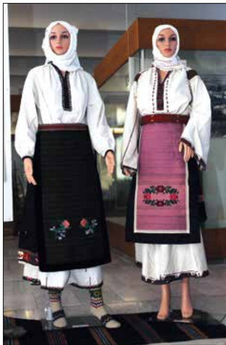
Обр. 6. Ризи „бърчанки“ от с. Карайсен и с. Павликени (ИМ – Павликени, осн.ф. „Етнография“, инв. № 256, инв. № 746)