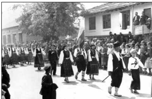
Обр. 2. Носии от с. Мусина, 1939 г. (ИМ – Павликени, осн.ф. „Етнография“, инв. № 731)