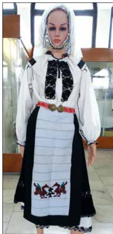
Обр. 4. Мъжка туникообразна риза с бродерия от с. Карайсен (ИМ – Павликени, осн.ф. „Етнография“, инв. № 688)