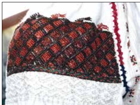
Обр. 7. Алтица на риза „бърчанка“ от с. Павликени, края на XIX в. (ИМ – Павликени, осн.ф. „Етнография“, инв. № 746)