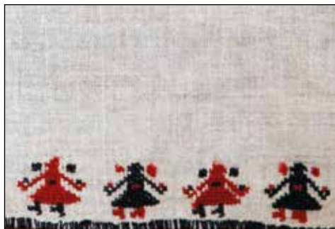
Обр. 10. Антропоморфни фигури по задни поли на риза „бърчанка“ от с. Сломер (ИМ – Павликени, осн.ф. „Етнография“, инв. № 314)