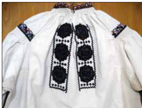
Обр. 8. Шевици по женска риза от с. Сломер (ИМ – Павликени, осн.ф. „Етнография“, инв. № 313)