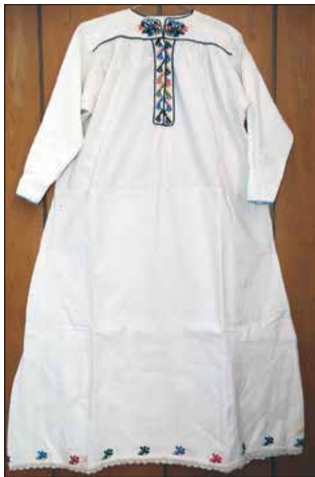
Обр. 5. Женска туникообразна риза от с. Паскалевец (ИМ – Павликени, осн.ф. „Етнография“, инв. № 69)