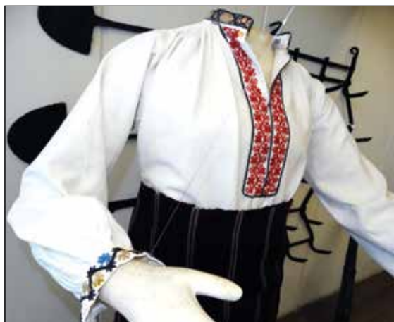
Обр. 3. Женска риза „бърчанка“ към двупрестилчена носия от с. Карайсен (ИМ – Павликени, осн.ф. „Етнография“, инв. № 359)