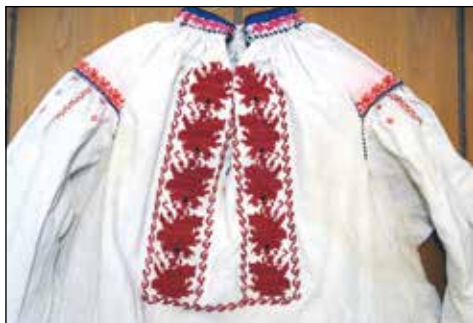
Обр. 9. Шевица на женска риза в червен цвят от с. Сломер (ИМ – Павликени, осн.ф. „Етнография“, инв. № 314)